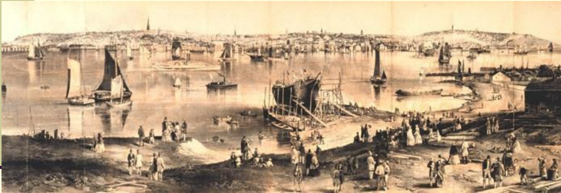
De haven - Portland, Maine, 1853.

Enkele jaren nadat Ellen en Elizabeth waren geboren, stopte Robert Harmon met boeren en verhuisde naar de stad Portland, ongeveer twaalf mijl naar het oosten, waar hij begon te werken als hoedenmaker.